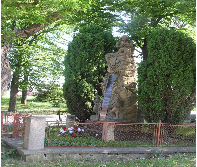
Památník tachlovickým obětem 1.sv. války

Všechna uvedená data jsou důležitými mezníky v našich dějinách a je na každém z nás, jakým způsobem si je důstojně připomeneme.